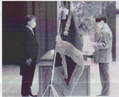
マスク着用での代表生徒の宣誓

80名の新入生を迎えることができました。今年度はコロナ感染予防策を万全にし、内容を精選した式でしたが、厳かに執り行われました。新入生も例年と変わらず、関高生になったぞと気を新たにしていました。